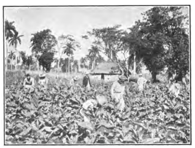
El Cultivo de Tabaco, Cuba

<sup>tes</sup> sus ricos valles donde se encuentran las mejores y más modernas maquinarias para la <sup>84</sup> preparación del azúcar. Los campos de ta-